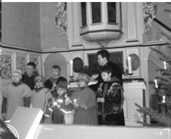
Krippenspiel in Groß Briesen